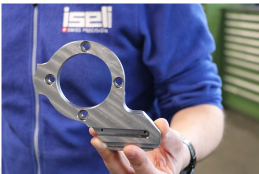
ISELI fertigt die für seine Maschinen benötigten Komponenten selbst. Dieses beispielhafte Bauteile wurde auf der automatisierten Makino PS105 mit pL-Drehtisch komplett bearbeitet.