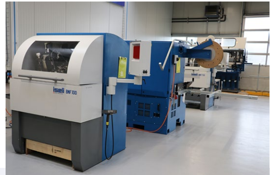
ISELI liefert Schärfräumausstattung für die Bearbeitung von Bandsägen, Gattersägen, Kreissägen und Messer – in Schweizer Präzision und Qualität.

Sind die beiden Schraubstöcke achsparallel gestellt, kann ISELI damit auch lange Bauteile spannen. Und wenn die Bauteile zu schwer für den Roboter sind oder schwer greifbare Konturen aufweisen, ist die Vorrichtung so ausgeführt, dass sie auch manuell bestückt werden kann.