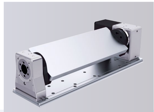
Drehtisch EA-520 mit rotoFIX von pL LEHMANN.